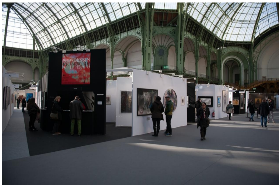
L'entrée et l'accueil du Salon 2020