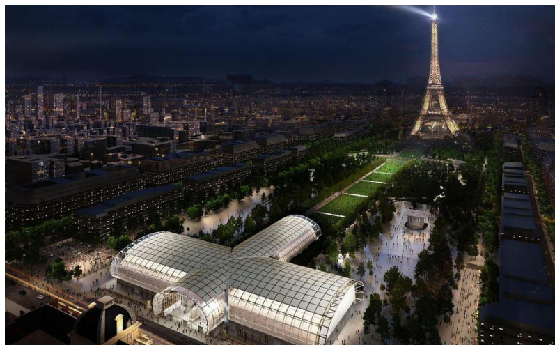
Grand Palais Ephemère – Wilmotte & Associés, architectes

Either large or small size works not complying with these dimensions will not be accepted and the exhibitor will NOT have any refund of any kind Do check carefully your hanging system